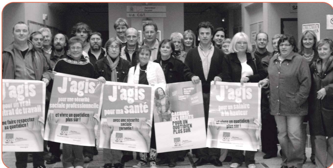
Les candidats CGT, une force à vos côtés